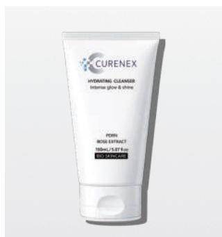
ハイドレーティングクレンザー ＜洗顔料＞ 150ml