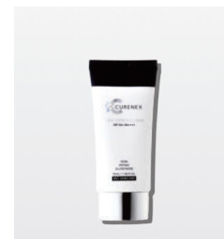
デイリーシアースンスクリーン ＜日焼け止め＞ 50ml

美容液やトナーで整えたあと、肌に塗布します。肌が乾燥していると感じたときいつでも塗布してください。