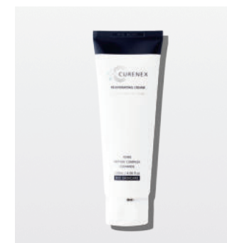
リジュベネイティングクリーム ＜保湿クリーム＞ 120ml

1～2プッシュを手に取り、顔全体になじませます。その後、必要に応じてクリームを重ねてください。