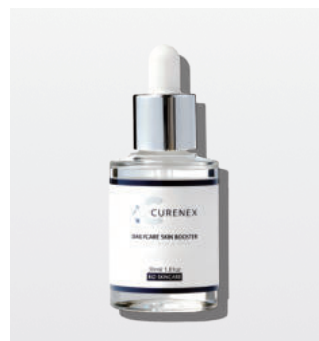
デイリーケアスキンブースター ＜導入美容液＞ 30ml