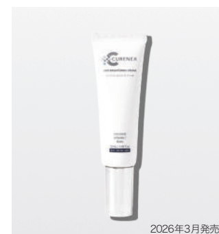
EXOブライティングクリーム ＜クリーム＞ 50ml

マスクを肌に密着させ、10～20分後マスクを外します。残った美容液を肌になじませてください。